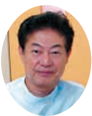
香川県保険医協会