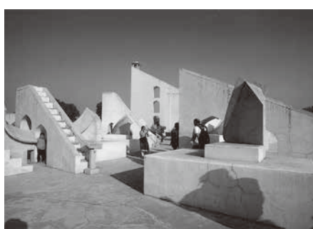
ジャンタル・マンタル(写真3)

だった。デリーでは、「インド門」、「フマユーン廟」(16世紀)ムガル2代皇帝の妃が創建、「レッドホート」(16世紀)ムガル5代皇帝の居城、「フリージガード」(マハトマ・ガンジールの埋葬地)、「クトゥブ・ミニナル」(13世紀、最初のイスラム王朝のモスク)(写真4)。さらにアグラ郊外の「ファテール・シークリー」