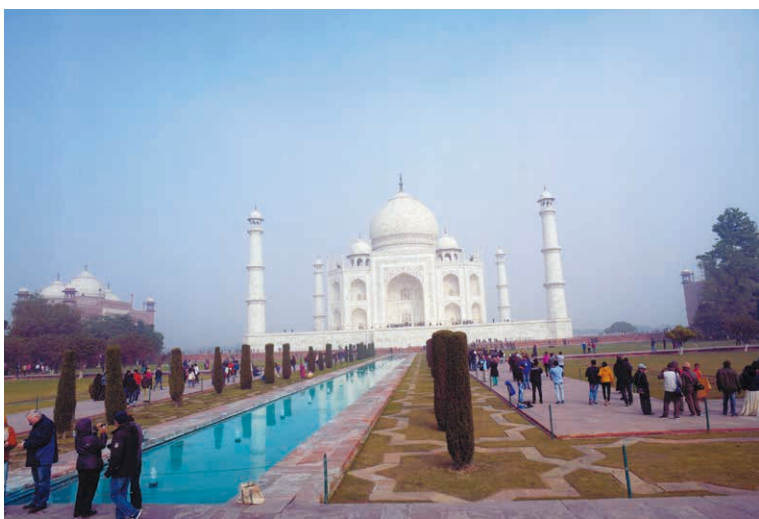
タージ・マハール (インド アグラ)