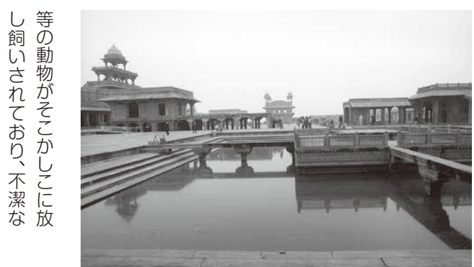
ファテール・シークリー(写真5)

人間の活動が拡大し、自然の破壊が進むたびに新しいウイルスの感染が起きてきた。バランスが崩れてしまった時に、人体では病気を発症し、国際政治は戦争が勃発する。バランスの崩壊から回復に至る過程では、腐海も感染症も、戦争も一定の役割がある。そう考えると、コロナは自然界と人間界のバランスを回復する役割なのかもしれない。今、まさにナウシカの世界が現実化しているのだとしたら、クワバラ、クワバラ