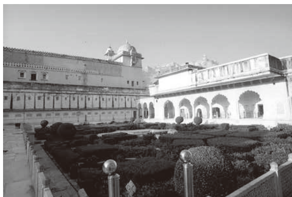
アンベール城(写真1)

「天文台」、「ジャンタル・マンタル」(18世紀)(写真3)、階段井戸「チャンド・バオリ」を観た。