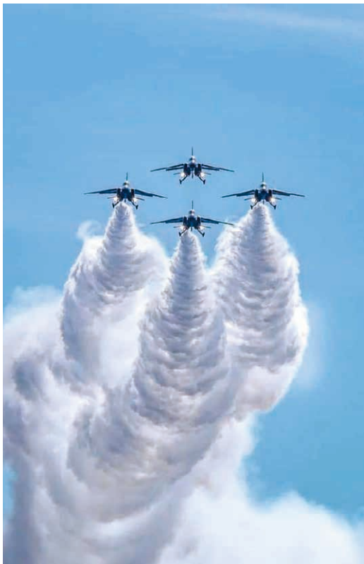
医療従事者への慰労飛行