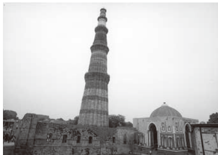
クトゥブ・ミナール(写真4)

今、訪ねたインドの歴史的建造物は、荘厳で美しく魅了された。一方で、街にはゴミが多く、牛・豚・犬