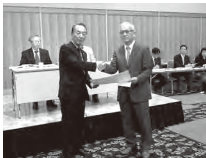
住江保団連会長から表彰されました

保団連第49回定期大会にて2つの部門で香川協会が表彰されました。第1部門は歯科開業医会費会員増加数が年間7人で第3位(1位東京61人、2位兵庫県24人)、第2の部門は年間歯科組織率上昇が1.6ポイントで第1位(2位兵庫0.910、3位石川0.909ポイント)でした。2つの部門で表彰されるといふ栄誉に輝いた