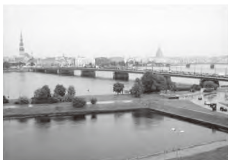
写真2 リガ(ラトビア)

な高層ビルも少ない。私達は閑空からヘルシンキを経て、リトアニアの首都ヴィリニウスに入った。ヴィリニウスはバルト海に面していないが、川や湖に囲まれた美しい町並みに心惹かれる。旧市庁舎を中心に旧市街が広がり、歴史ある建物は中世そのものである。聖ペテロパウロ教会、大聖堂、聖