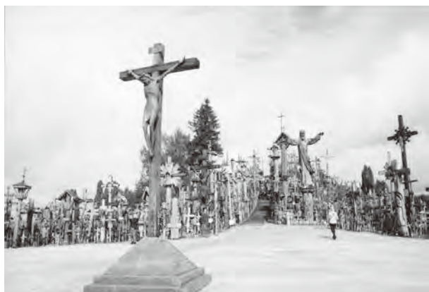
写真1 十字架の丘 (シャウレイ、リトアニア)

アンナ教会など、どれも素晴らしい。近郊には14世紀の首都トラカイがあり、赤色のトラカイ城(6面写真展)が湖の上に浮かんでいて格別に美しい。他にリトアニアで必見は、シャウレイの十字架の丘とカウナスの杉原千畝記念館である。十字架の丘(写真1)は1830年、ロシアに抵抗して戦死した犠牲者に祈りを捧げるために立てられたもので、リトアニア人の聖地である。夥しい十字架群の前にキリストの処刑像が浮き出立ち、見上げれば胸に迫るものがある。杉原記念館は、日本のシンドラー(ナチスと日本軍に屈せず、日本経由で第三国へ行けるビザを発行して6,000人もユダヤ人の命を救ったとして有名な杉原千畝の記念館である。彼の写真の前で私は長い時間合掌した。