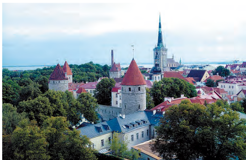
タリン市街(エストニア)