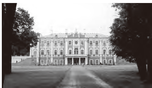
写真4 カドリオルグ美術館(タリン、エストニア)

シャウレイから2時間、ラトビアのリガに到着した。リガはバルト海に注ぐダウガヴァ川を中心に発展した街(写真2)で、アールヌーボー様式の木造建築と中世の旧市街で知られている。また、中世後期北ドイツの都市同盟でバルト海沿岸の貿易を支配したハンザ同盟の拠点であり、その関連の建物が多く今でも会館や会社などに使われている。ハンザ同盟友愛館「ブラックヘッド会館(写真3)は中々有名で、代表者の黒人の像が置かれている。同盟に入会を拒まれた大商人が、腹いせに会館に尻を向けた猫を尖塔に飾った「猫の家」や、15、17各世紀に建てられて並ぶ3軒の家「三人兄弟」も街の見所である。郊外にはラトビアのスイスと言われる景勝地にある、赤い塔のトゥライダ城、スィグルダ城跡、そしてロシア皇帝が建てた壮麗なルンダーレ宮殿など、どれも歴史ある美を放っていた。