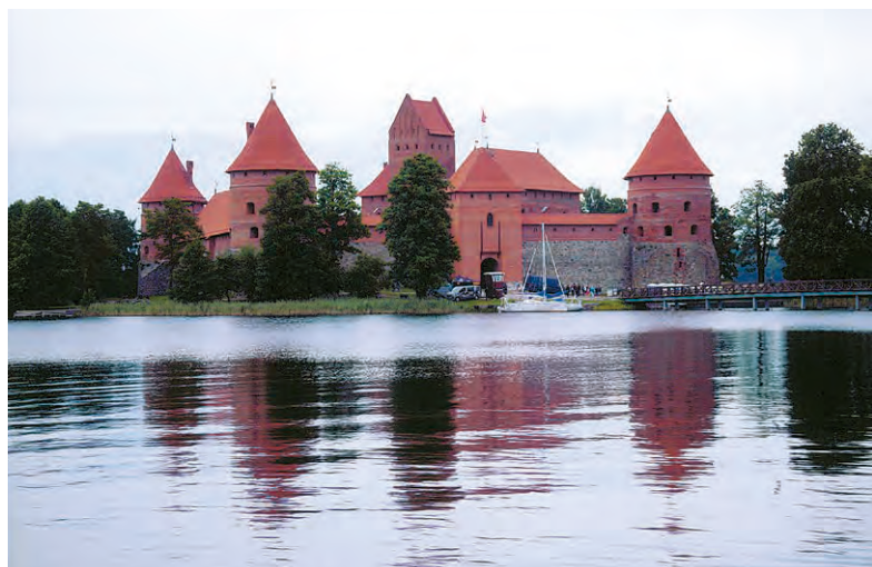
トラカイ城(リトアニア)