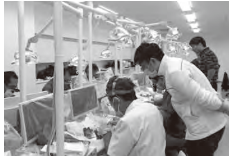
実習には講師3名アシスタントと5名がサポートしました

2019年の11月10日(日) 9時半～16時まで穴吹医療 大学校において、『豚顎骨を