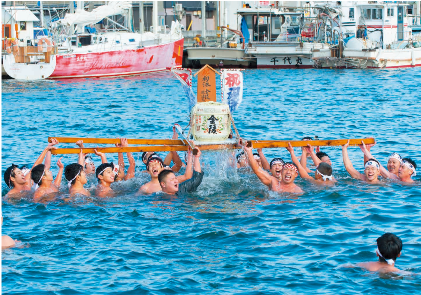
初 泳 (多度津港)