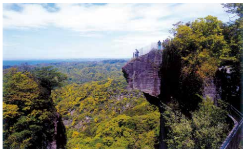
P4 鋸山 地獄のぞき(房総)