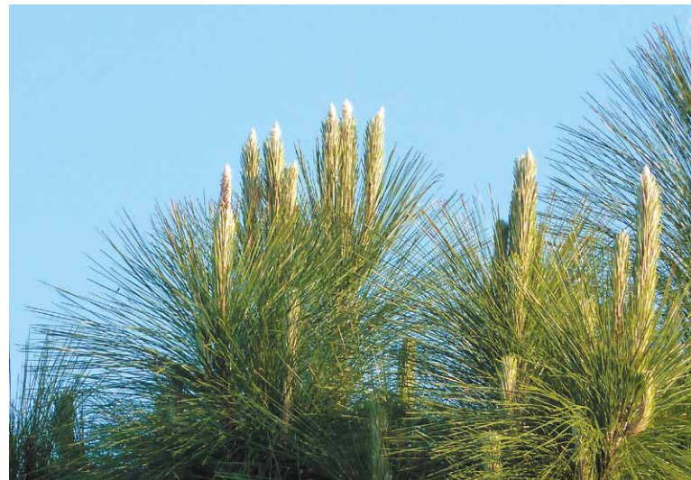
春の「マツ」 さぬき市 服部啓吾