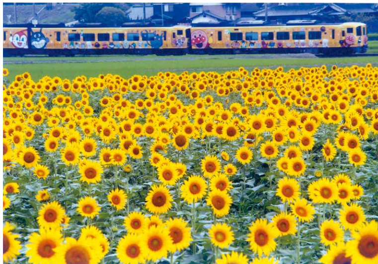
アンパンマン列車がゆく 東かがわ市 三木一美