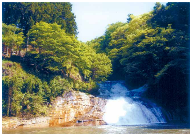
P1 養老の滝(養老溪谷)

次は、桜と紅葉の季節に行きたいと思つています。そして九十九里浜など東房総にも行ってみたいですね。 とはいつもの「ロシアの侵略」「コロナ禍の医療」「円安物価高の経済問題」「軍事費の拡張」「憲法改悪など軍国化」「内心の自由に対する安倍元総理の国葬実施」等々困難な問題が数多く有り、私達が声を上げ、行動する必要があります。気軽に旅行を楽しむためにも、今、踏ん張り時かなと思う今日この頃です。