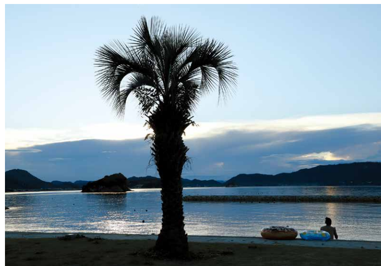
夏の浜辺 東かがわ市 三木登志也