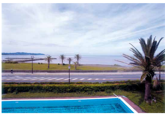
P3 館山湾(鏡ヶ浦 房総)

とはやや異なる風情が有り心が奪われました。翌日、館山の北の金谷に位置する鋸山(のこぎりやま)に行きました。この山は山全体が日本寺といつ有名な寺院ですが、何と云っても圧巻は地獄のぞき(P4)でした。 今回の旅行は、孫と会えたり、房総半島の絶景を観ることが出来て久しぶりに心満たされた日々でした。