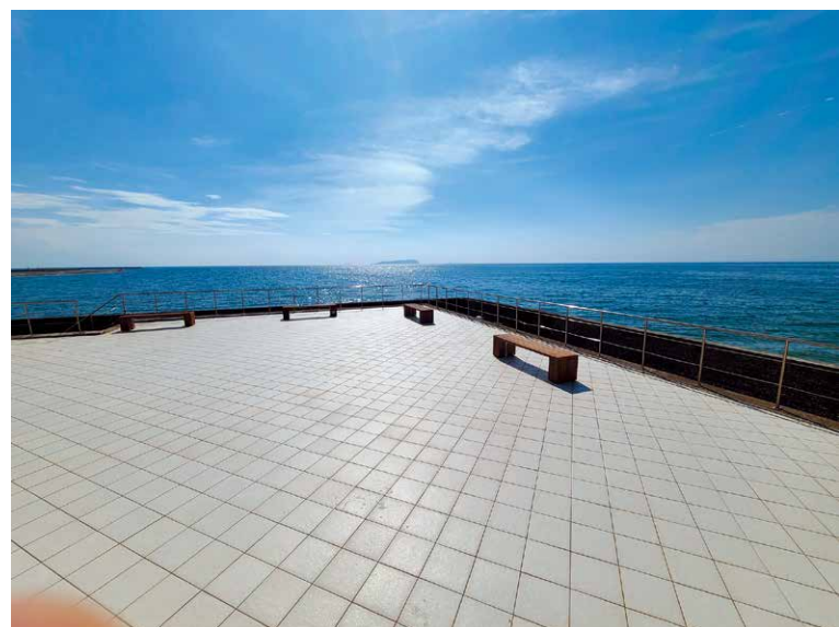
夏の海 仲多度郡 詫間隆弘